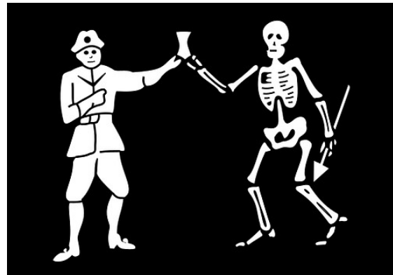
Bartholomew Roberts (1719 – 1720)