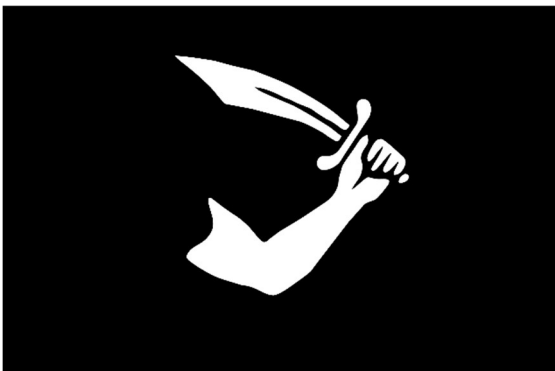
Thomas Tew (1692 – 1695)